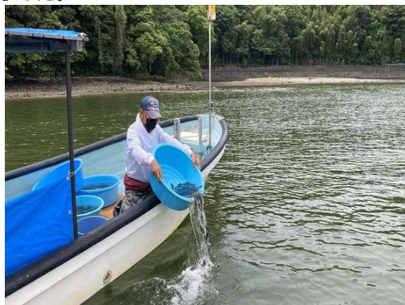
●ヒラメの種苗放流の様子

また、水産資源の増殖と漁業生産量の拡大を図るため、高知県漁業協同組合が行う、高知市の浦戸湾への水産動物の種苗放流事業に要する経費に対して、寄附金の一部を充てさせていただきました。