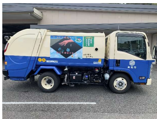
令和4年度 環境標語優秀作品