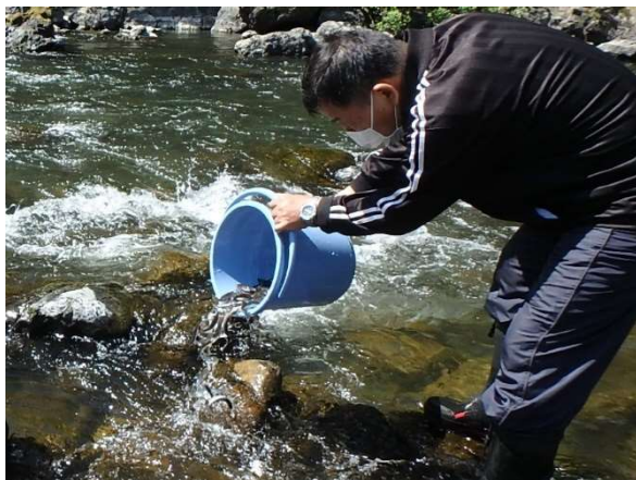
●アユの放流の様子

高知市の中心部を流れ、アユなど水生生物が多く生息する「鏡川」は市民に親しみのある河川です。この河川環境を保護するため、アユ、アメゴ、ウナギの放流事業に寄附金の一部を充てさせていただきました。