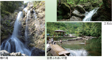
梅の滝 吉原ふれあいの里