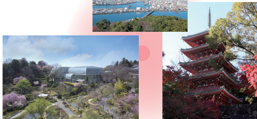
五台山展望台からの眺め 牧野植物園 竹林寺