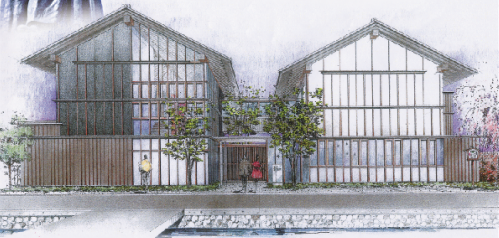
〔(仮称)龍馬の生まれたまち記念館〕完成予想図