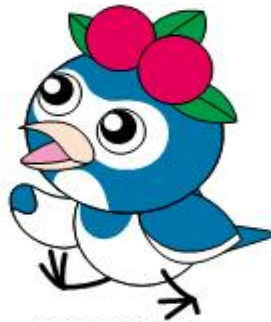
環境維新・高知市 マスコットキャラクター「ケーちゃん」