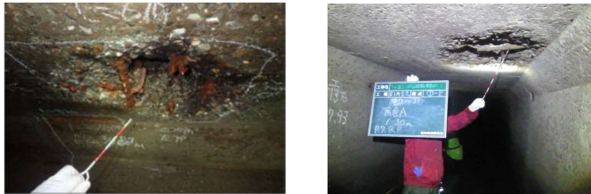
管内の腐食・破損状況

特別重点調査において緊急度ⅠおよびⅡと判定された管路のうち、0.43kmの対策が完了する。また、避難所等の重要施設に接続されている下水道管路の耐震化を図ることができる。