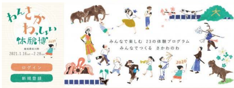
▲体験型地域資源開発・活用事業 (体験型イベントの実施 左: つのつねづね (津野町) 右上: とさんぼ (土佐町) 右下: わんさかわっしょい (佐川町) )