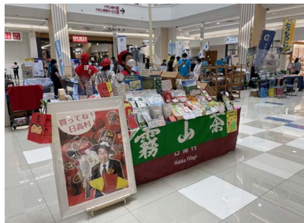
▲地場産品販路拡大推進事業 (R3.6月開催のTSUNAGU～高知家の底力カラ～マーケットの様子@イオンモール高知)