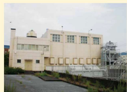
米田古川ポンプ場