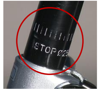
(写真) サドルのはめ合わせ限界標識

固定部の締め付けが不足していたり緩み、ゆがみがあると、走行中に車輪やハンドル、サドル、ペダル等が脱落して、転倒するおそれがあります。