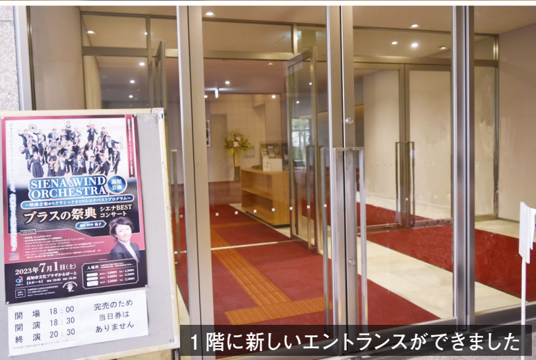
1階に新しいエントランスができました