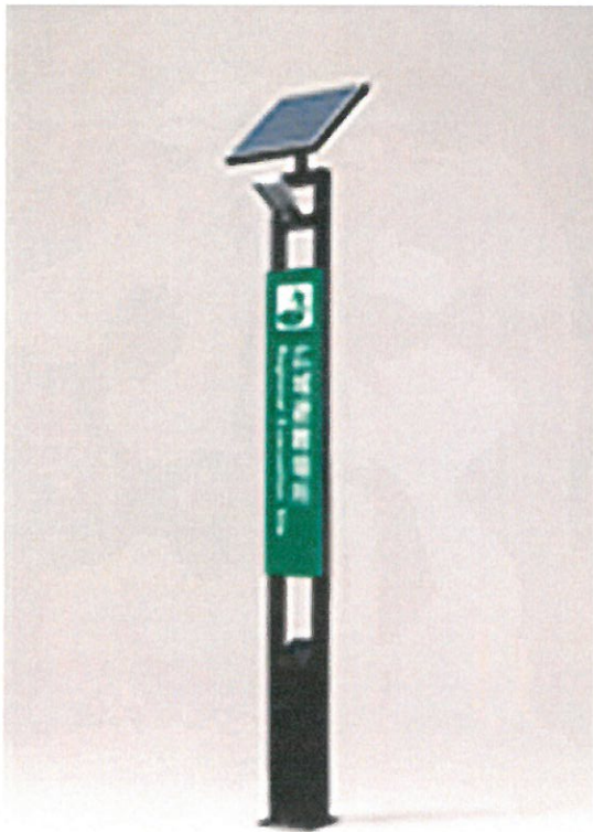
太陽光パネル街灯