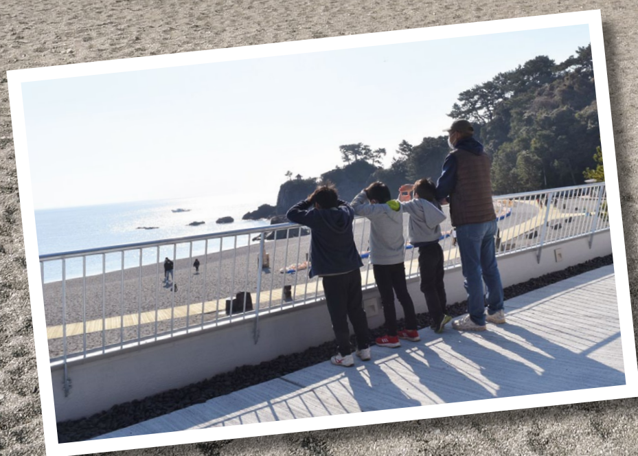
令和3年12月に完成した桂浜の本浜休憩所