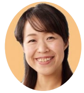
日本共産党 はた あい はた 愛

答 (市長) 鏡・土佐山地域を 含めた中山間地域の振興に関する 施策の検討および総合調整を行う 機関として、私(市長)を本部長 とする「中山間地域振興対策本部 会」を設置しており、この本部会 において部局間連携を図りながら 計画を推進してまいります。