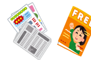
新聞広告・新聞折り込み・フリーペーパー広告