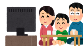
歳末・新春大売り出しの告知TVCM

【委託先】 広告代理店 【事業内容】 テレビCM等広告費用の3/4（上限あり）を支援 【支援上限】 300千円 【支援想定数】 300者