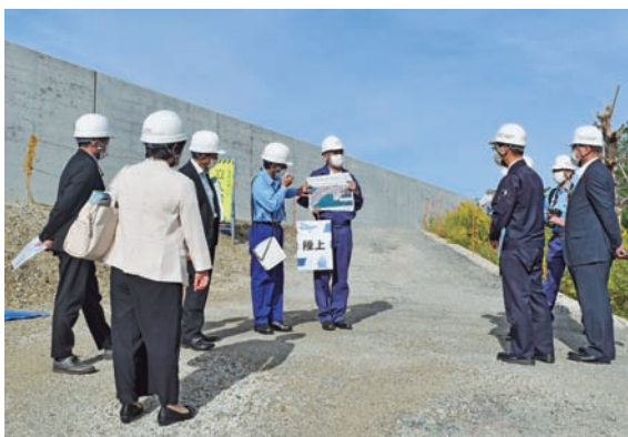
高知港海岸での視察