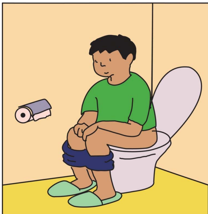
トイレにいるとき