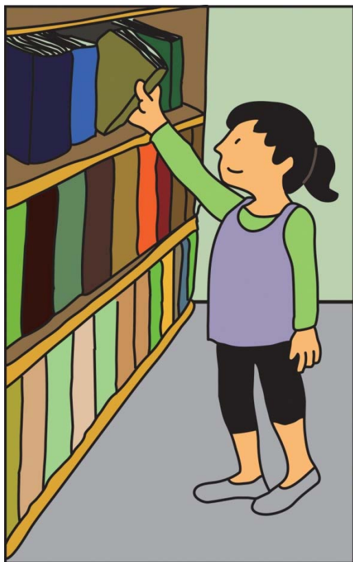
としょかんにいるとき