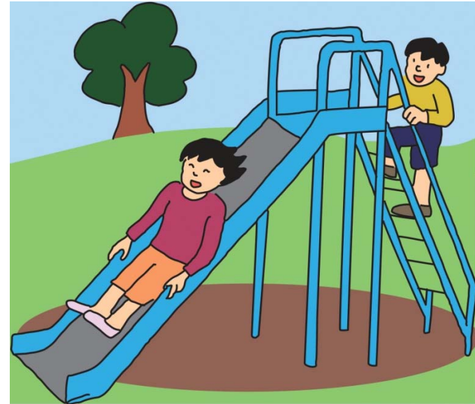
こうえんで、あそんでいるとき