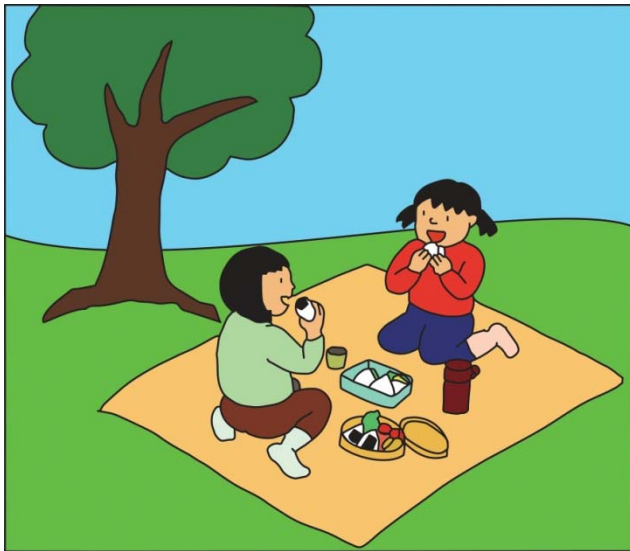
えんそくにいらっているとき