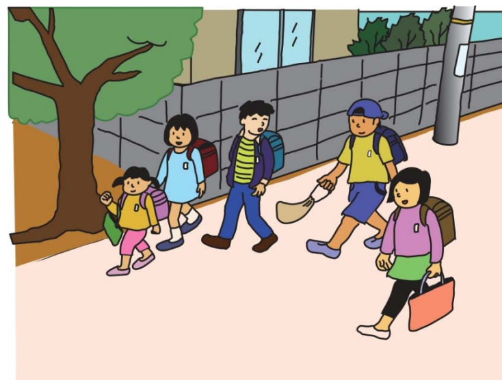
がっこうにいているとき (がっこうからかえっているとき)