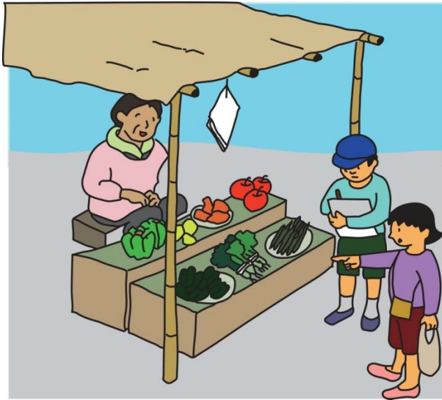
がっこうのそとで、かつどうをしているとき