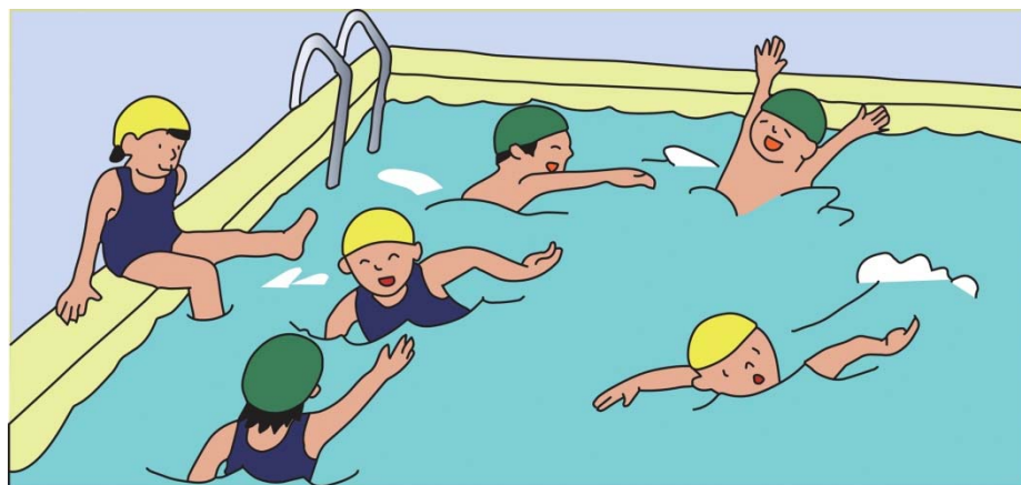
プーで、すいえいをしているとき