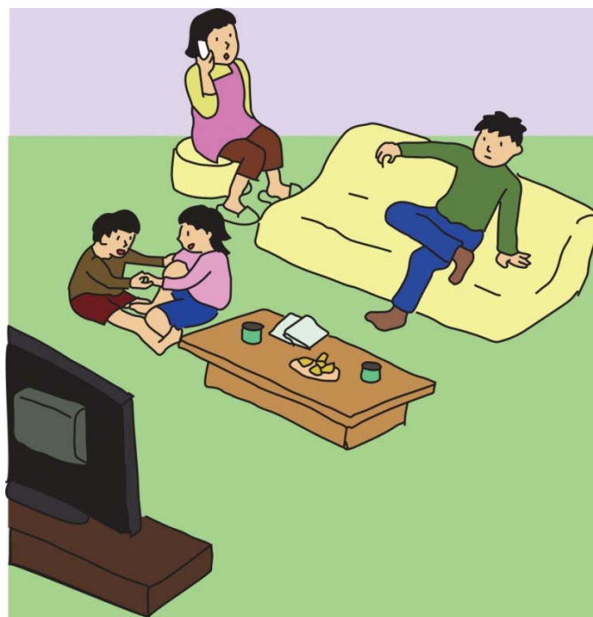
かぞくでいっしょにいるとき