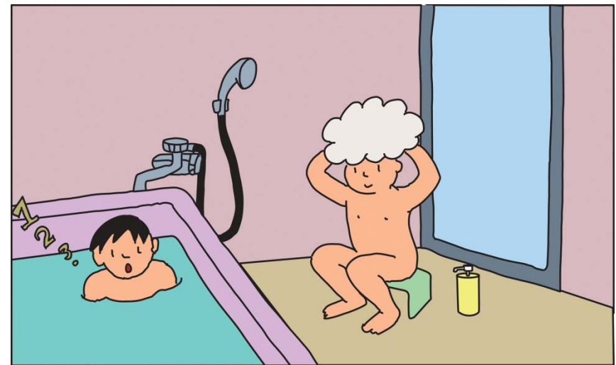
おふろにはいらっているとき