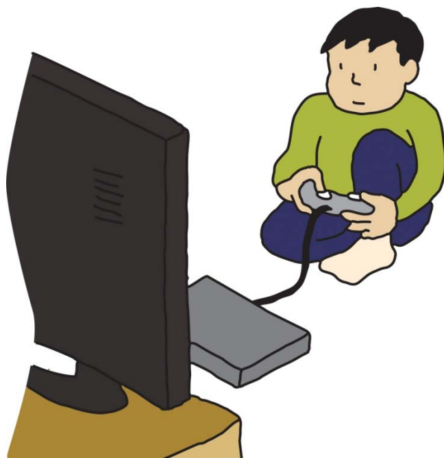
ひとりでるすばんしているとき