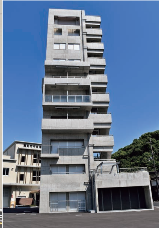
高さ30メートルの高層訓練棟を備える中央消防署（10月開所）