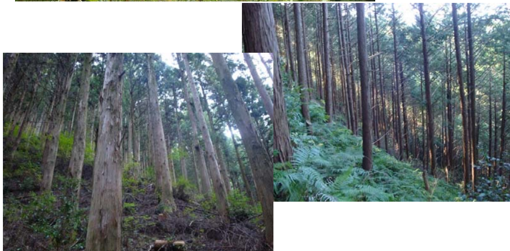
※間伐を終えた市有林内