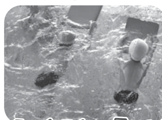
みかづきスイミングスクール

スイミング・トランポリン・マット運動・跳び箱・ボール投げ等の色んな要素を少しずつ習慣的に遊びの中に取り入れ、子どもたちは自然に楽しく活動します。友達を見て「やってみたい」と思うようになり、小さなことがちょっとできるようになると苦手を意識しなくなります。将来運動を楽しめるように！