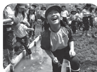
みかづきの里と森

家庭排水の入らない湧き水のある綺麗なみかづきの里山の自然で、教室にはない色・匂い・音・味が幼児期の子どもたちの脳に良い刺激を与え、感性を育てます。日常的に里山や森の豊かな生命にふれあうことにより、人の痛みを感じることでできる、感受性豊かな優しい心を持った子に育ちます。