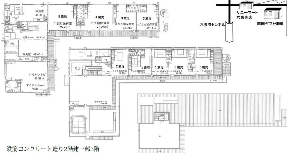
鉄筋コンクリート造り2階建一部3階