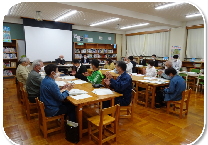
▲江ノ口連携協議会設立会議の様子。