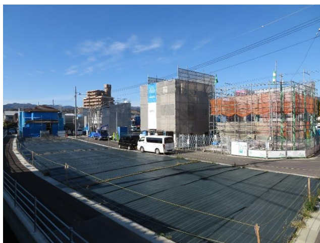
【16, 17 街区周辺】