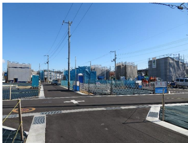
【14, 15 街区周辺】