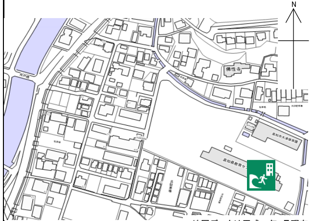
地図データは平成26年4月現在