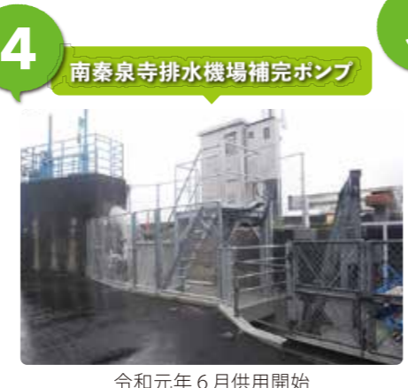
令和元年6月供用開始