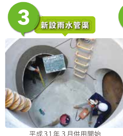
平成31年3月供用開始

平成26年8月豪雨で広範囲の浸水被害が発生した秦地区では、北消防署の新設や高知赤十字病院の移転、都市計画道路高知駅秦南町線の整備などの新たな街づくりに合わせて、雨水管渠(直径1.5m、延長127.5m)、東秦泉寺補完ポンプ(直径0.8m、毎分75m 3 排出)、南秦泉寺補完ポンプ(直径0.6m、毎分47m 3 排出)を整備しました。