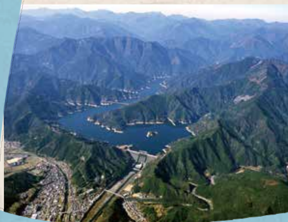
早明浦ダム