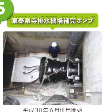
平成30年6月供用開始