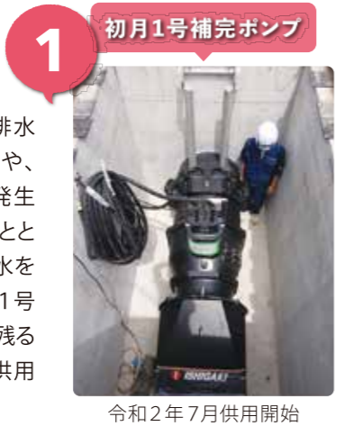
令和2年7月供用開始

平成26年8月豪雨では、既存の下水道施設の排水能力を超える1時間に100mm超の降雨があったことや、久万川・紅水川の氾濫により、広範囲で浸水被害が発生したことから、県市で連携して浸水対策を進めていくこととしています。高知市上下水道局では、水路から直接排水を行う補完ポンプ2基を整備する予定としており、初月1号補完ポンプは令和2年7月に供用を開始しています。残る初月2号補完ポンプについては、令和3年度早期の供用開始を目指して、整備を進めていくこととしています。