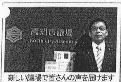
新しい議場で皆さんの声を届けます