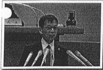
写真は6月議会のものです