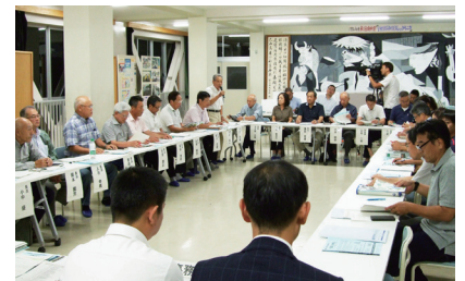
▲9月4日に開催された設立総会の様子

9月4日(月)午後7時から南海中学校を会場に、長浜・御豊瀬・浦戸地域活性化協議会の設立総会が開かれました。設立総会では、活性化協議会設立総会の呼び掛け人である、