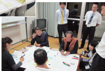
御畳瀬地区部会▶ (11月2日開催)