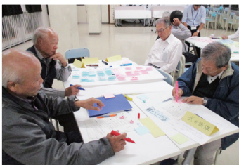
▲長浜地区部会 (10月17日開催)

また、浦戸地区では、住民の皆さんのご意見をお伺いすることとし、各町内会を通じてアンケートを実施するとともに、浦戸地区限定のかわら版を発行することとなりました。