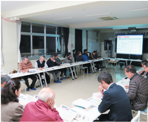
▲ 11月22日に開催された第2回総会の様子

その後、この地域に関連する高知市の計画について、市観光振興課から「高知市の観光振興の取組」、市都市計画課から「都市計画マスタープラン」について、それぞれ説明がありました(裏面で一部ご紹介いたします)。