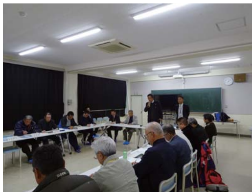
▲3月23日に開催された第4回総会の様子

その後、第3回総会以降に開催された役員会で検討した内容(①外部有識者による講演会に向けた地域事前視察②高知県立大学との連携③今年度の活動内容のまとめ及び来年度の進め方)について報告がありました。