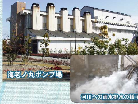
河川への雨水排水の様子

雨水ポンプ場には市街地に降った雨を河川などに排水する役割があり、浸水対策事業として整備を進めてきました。前号では「高知市における浸水対策の歴史」についてお伝えしましたが、連載第3回の今号ではポンプ稼働状況や大雨への備えについてお伝えします。