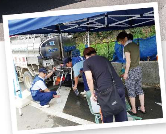
平成30年7月の豪雨災害で高知市上下水道局職員が応急給水活動をした際の様子(宇和島市)

令和2年3月に新しい給水車が上下水道局に仲間入りしました。新しい給水車は、3,500リットルの飲料水を運ぶことができます。現在活躍している給水車(2,000リットル積載可能)と力を合わせることで、災害発生時には、より多くの市民の皆さまへの給水や病院の受水槽への充水など、今までよりも効率的な応急給水活動ができるようになりました。