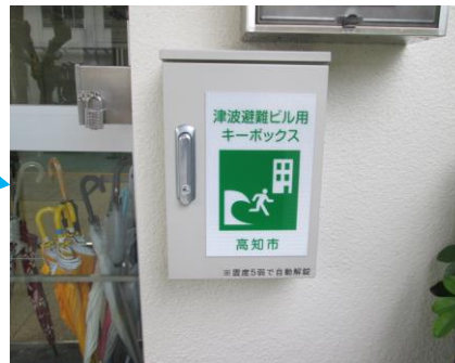
自動解錠装置付キーボックス