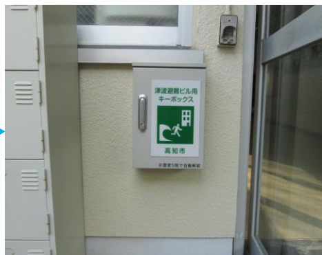
自動解錠装置付キーボックス