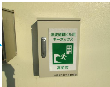
自動解錠装置付キーボックス