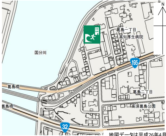
地図データは平成26年4月現在