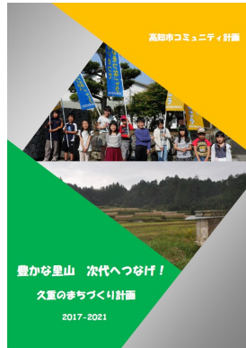
▲久重地域とよこせと地域で策定したコミュニティ計画の冊子。