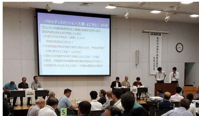
▲パネルディスカッションでは、コミュニティ計画を策定した2地域内連携協議会（久重・よこせと）から取組内容等の紹介がありました。