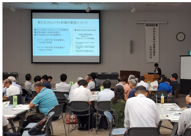
▲高知市が、コミュニティ計画の策定・更新についての方針の説明をしました。