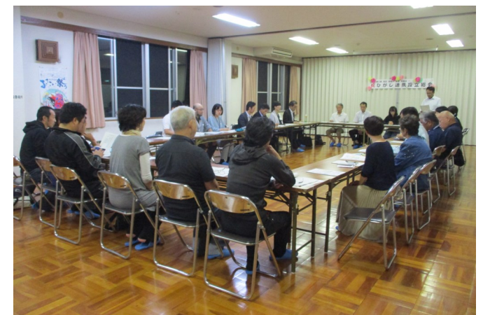
▲潮江東小学校区地域内連携協議会設立総会の様子