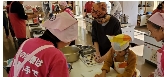
▲収穫した芋で楽しく料理しました。