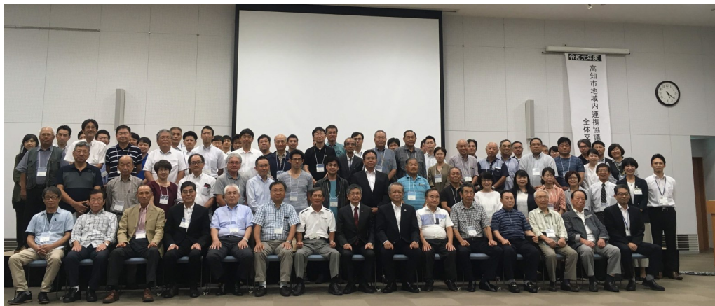
◀当日はおよそ100名が参加し、地域内連携協議会同士や市との意見交換・情報共有を行いました。