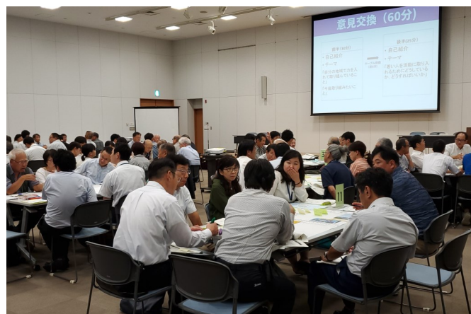
▲ワークショップで活動等を紹介し合い、他の地域との交流を深めました。