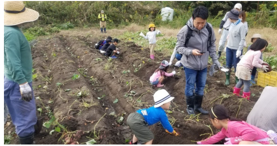
▲未来塾農園での芋掘りの様子

地域のヘルスメイトさんにもお手伝いいただき、「さつまいものハニーレモン」「いきなりだんご」の2品を作り、みんなで美味しくいただきました。