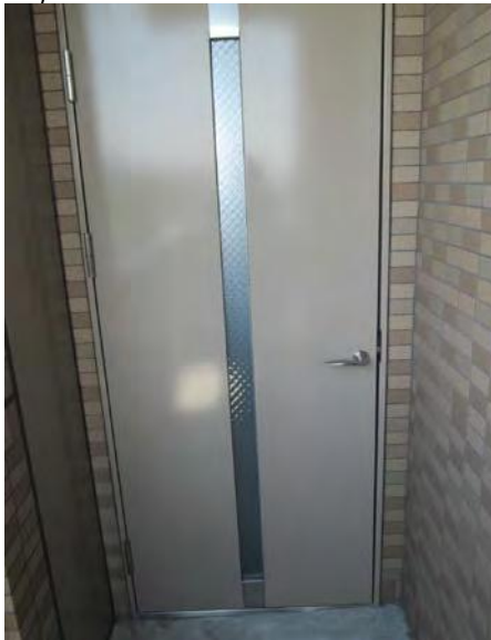
外階段から避難スペースへの入