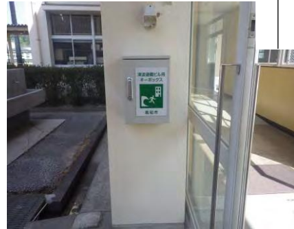
自動解錠装置付キーボックス