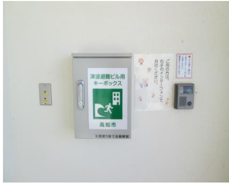
自動解錠装置付キーボックス