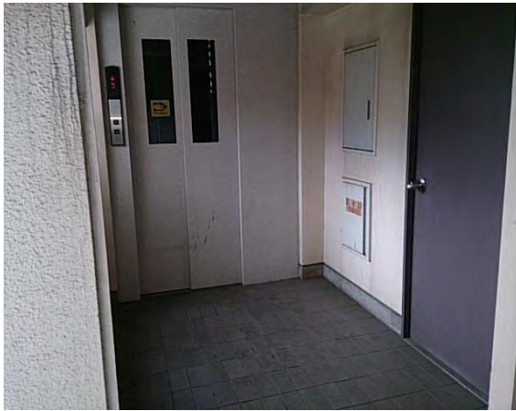
エレベーターホール