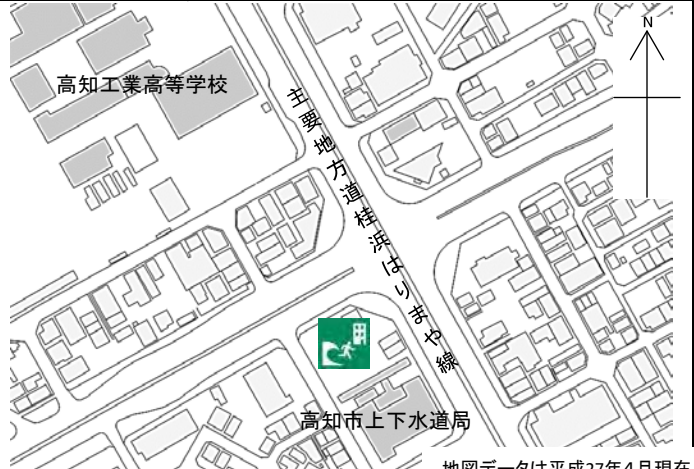
地図データは平成27年4月現在