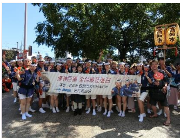
今年度のよさこい演舞の様子 (第65回よさこい祭り)