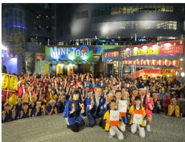
昨年度のよさこい演舞の様子 (漢神アリーナ)

■本県への外国人延べ宿泊者数は、年々増加しており、その中でも、台湾は全体の約3割を占めていることから、台湾南部最大の都市である高雄市(人口278万人)におけるプロモーションの展開により、観光客のさらなる誘客につなげていきたい。