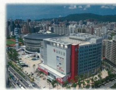
漢神アリーナショッピングプラザ