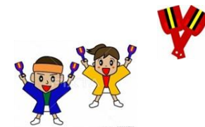
よさこいを通じた交流・PR

■高雄市政府を訪問し、本市のよさこい祭りへの参加について報告するとともに、今後、観光を通じた交流人口の拡大について意見交換を行う。