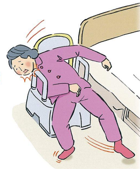
※参考:公益財団法人 テクノイド協会 福祉用具ヒヤリ・ハット情報

ご使用中のお客様には大変ご迷惑をおかけいたしますことを深くお詫び申し上げます。何卒ご理解とご協力をお願い申し上げます。