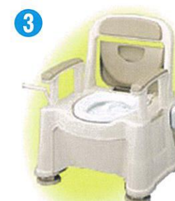
品名:ポータブルトイレ座楽SPあたたか 品番:APTSP