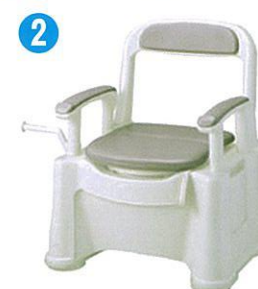
品名:ポータブルトイレ座楽背もたれ型SPソフト便座・便フタタイプ 品番:SPTSPS