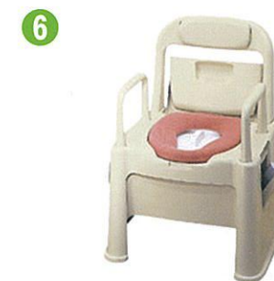
品名:ポータブルトイレ座楽背もたれ型SB 品番:SPTSB