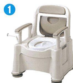
品名:ポータブルトイレ座楽背もたれ型SP 品番:SPTSP