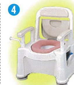
品名:ポータブルトイレ座楽背もたれ型SP小口径便座タイプ 品番:SPTSPMB