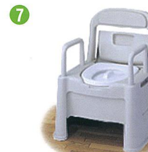
品名:ポータブルトイレ座楽背もたれ型HD 品番:SPTH