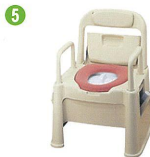
品名:ポータブルトイレ座楽背もたれ型 品番:SPTSD