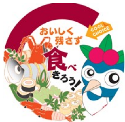
環境維新・高知市マスコットキャラクター「ケーちゃん」

★食品ロスを減らすためには、一人一人がもったいないを意識して行動することが大切です。