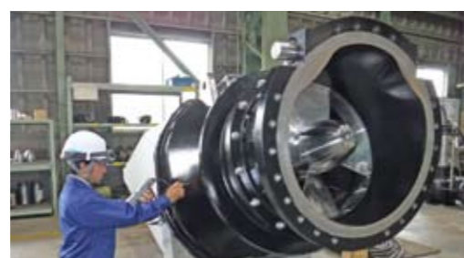
浸水からまちを守ります 秦地区浸水対策事業