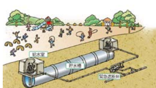
災害時の水を確保します 春野高等学校耐震性非常用貯水槽設置工事