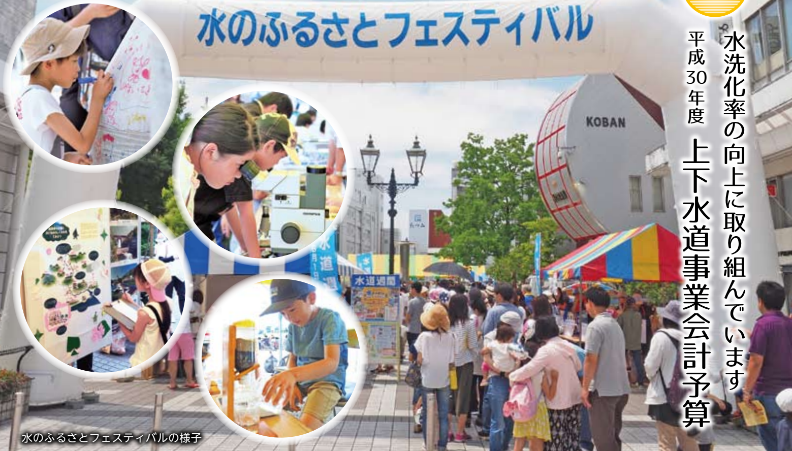
水のふるさとフェスティバルの様子