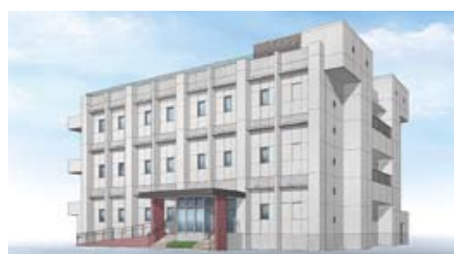
災害に強い施設となります 下知水再生センター管理棟改築工事