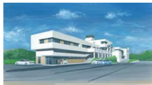
施設の機能を拡充します(平成30年度完成) 針木浄水場水質管理センター増改修