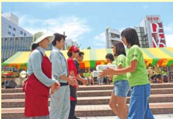
横浜新町小学校の児童から感謝品の贈呈が行われました。

高知市の水道水は、源流から河口までが市域にある鏡川、四国最大の水がめ早明浦ダムのある吉野川水系の瀬戸川に平石川、仁淀ブルーで有名な仁淀川を水源としています。これらの原水は非常にきれいで、全国に誇れるものとなっております。