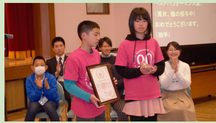
高知市立久重小学校6年生

活動内容や発表会でのプレゼンテーションが一番良かったグループ(会場投票により決定)