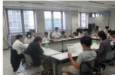
こども審査員と大人審査員が応募団体に関する情報を共有します。