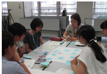
「こどもファンド」の制度や趣旨を学び、審査項目を決定します。