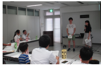
翌週に迫った公開審査会のプレ体験をします。