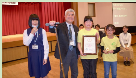
旭地区防災食プロジェクト

活動の進め方や活動内容について、工夫や面白さが感じられたグループ(審査員投票により決定)