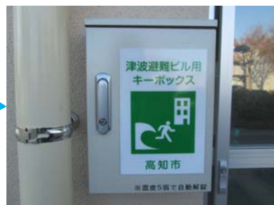
自動解錠装置付キーボックス