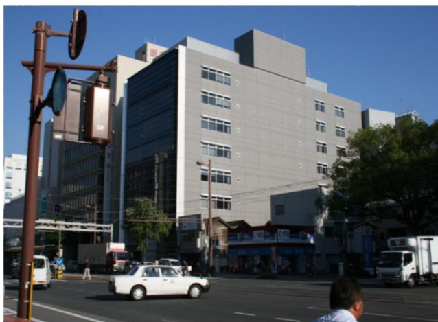
【図1：高知市生活支援相談センターの位置と業務時間について】

市役所と近距離にあることから、相談者に市の窓口の紹介をしたり、相談者に同行することが容易にでき、また、市役所の窓口に来所された方がセンターに相談に来やすい、といった利点があります。