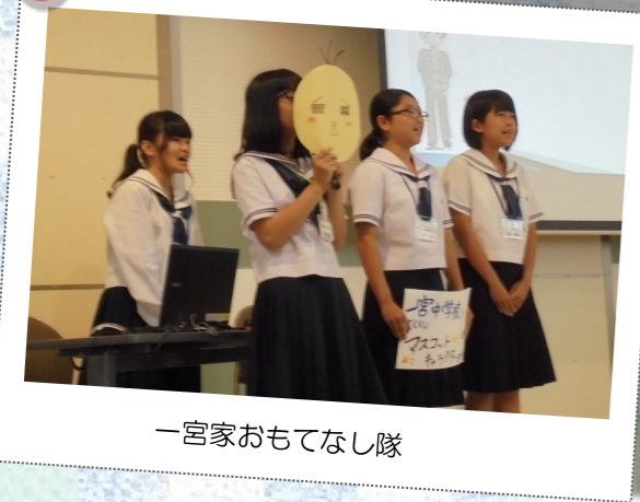
一宮家おもてなし隊