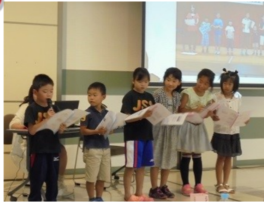
瀬戸東町1・2丁目元気キッズ