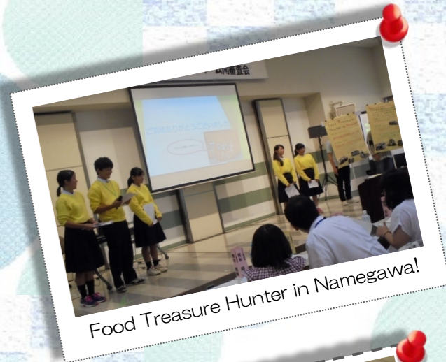
Food Treasure Hunter in Namegawa!