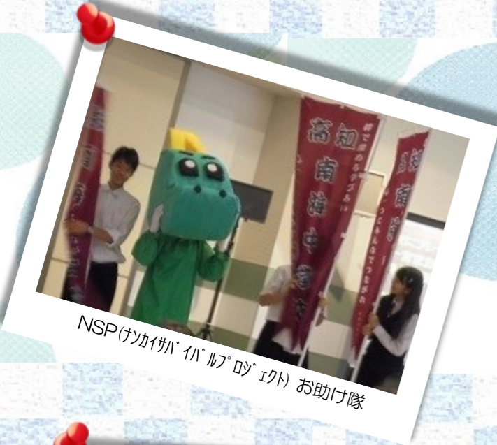
NSP(ナカイカハ"ハル"プロジェクト) お助け隊