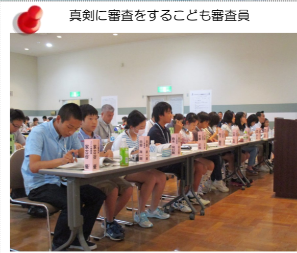
真剣に審査をすることも審査員