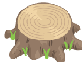
←【四万七千ノキ一万ピースの積み木】 たくさんの積み木で、子どもたちはものすごく真剣に遊んでました