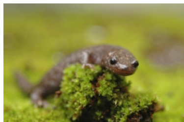
↑環境問題部門グランプリ作品