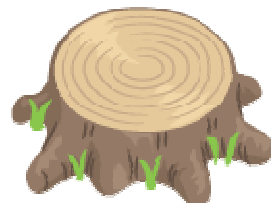
【木の手作りおもちゃで遊ぶ】← コロコロコロコロ子どもたちは大興奮! たくさんのちびっ子で賑わっていました