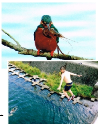
→スマホ部門入選作品→