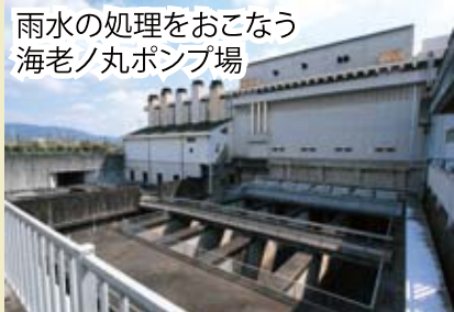
雨水の処理をおこなう海老ノ丸ポンプ場

高知市では、平成26年4月1日より上水道事業と下水道事業を組織統合することとなりました。窓口サービスの一元化によるお客さまの利便性の向上や、共通事務にかかる人件費やシステム経費の削減等を図り、現在統合の準備を進めています。