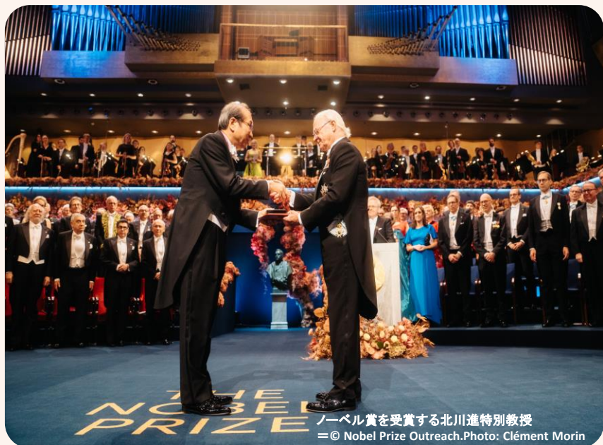
ノーベル賞を受賞する北川進特別教授

2025年ノーベル化学賞を受賞した北川進京都大学特別教授を本市にお招きし、市民の科学への関心を高めるとともに、未来を担う児童・生徒が世界最高峰の知見に触れる機会を提供します。