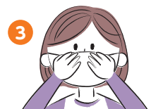
隙間がないよう鼻まで覆う