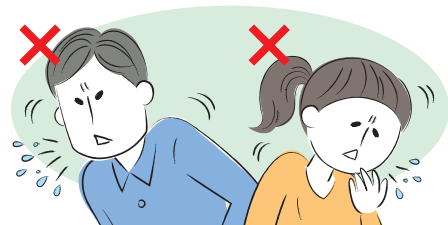
何もせずに咳やくしゃみをする