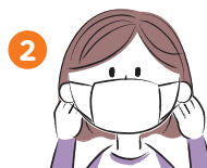
ゴムひもを耳にかける