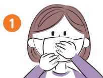
鼻と口の両方を確実に覆う