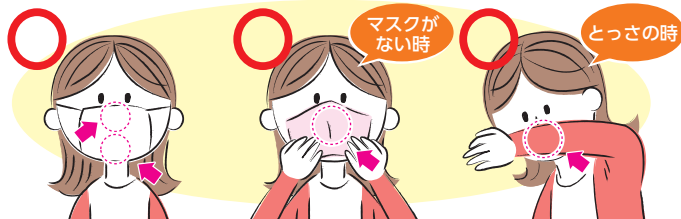
マスクを着用する (口・鼻を覆う)